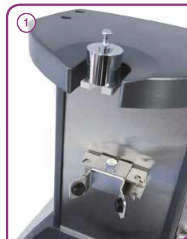
Utilizzo come bilancia semi-analitica (certificato DKD)