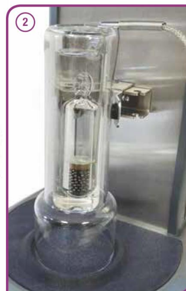
Sistema rapido di allineamento cilindro-pescante