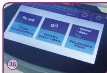
Facile accesso ai programmi d'analisi