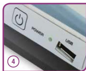
Uscita dati tramite USB