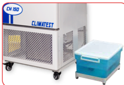
Contenitore esterno per l'acqua di alimentazione del generatore di vapore, fornito di serie