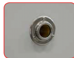
Foro passante laterale di 25 mm per l'installazione di sensori all'interno della camera