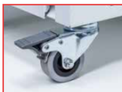
Set di ruote girevoli