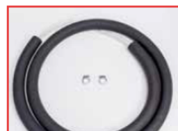
Set di tubi con isolante e fascette

Lo spazio all'interno della vasca è completamente utilizzabile grazie alla disposizione ottimale della serpentina di raffreddamento.