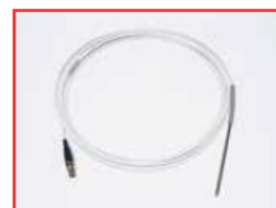
Sonda PT100 TFE di ricambio