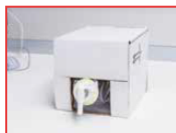
Fluido termico in fusto da 5 litri