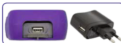
Uscita USB per scarico dati ed alimentazione tramite PC o alimentatore a rete fornito di serie (OXY70)