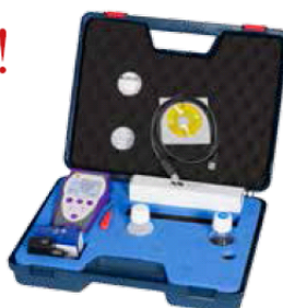
OXY 70 con valigia da trasporto