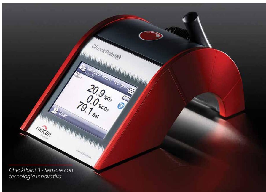
CheckPoint 3 - Sensore con tecnologia innovativa