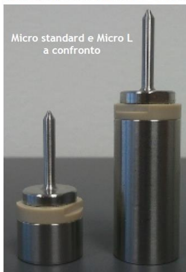
Micro standard e Micro L a confronto

Tutti i data logger funzionano con la DiskInterface HS. Per la versione standard è disponibile anche la DiskInterface HS. Il software SPD è incluso con le interfacce.