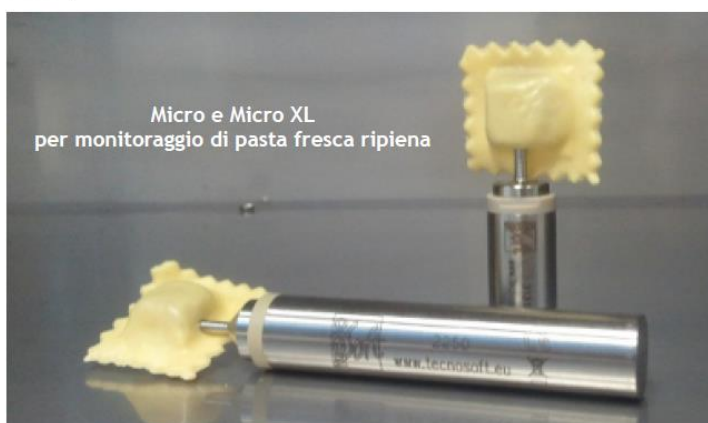
Micro e Micro XL per monitoraggio di pasta fresca ripiena