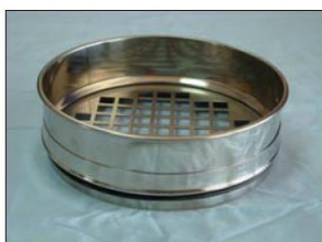
Setacci con piastra in acciaio inox forata (quadrato)