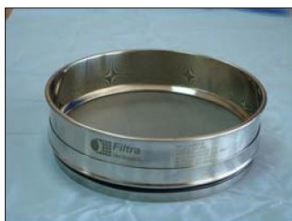
Setacci inox con rete metallica in acciaio.

Setacci Filtra per test di laboratorio, con maglia metallica o con piastra perforata (quadrata, rotonda o ovale), secondo le norme nazionali ed internazionali standard: UNE, ISO, ASTM, AFNOR, BS, etc.