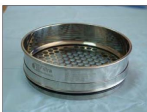
Setacci con piastra in acciaio inox forata (rotondo)