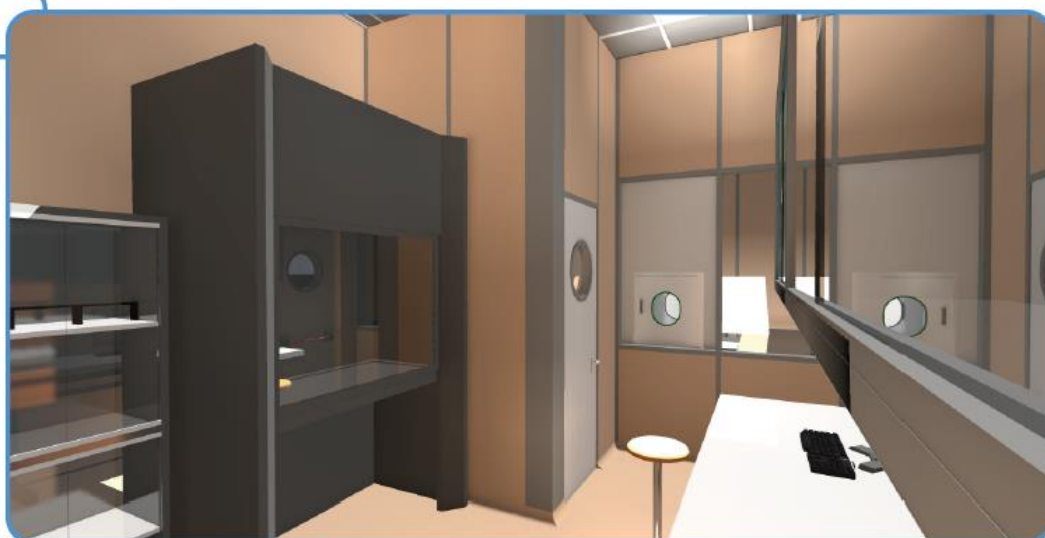
Camera bianca a pressione positiva