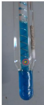
Setto poroso giallo