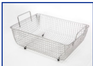
Cestello compatibile con tutti i modelli

* SS-200 non incluso nella confezione standard.