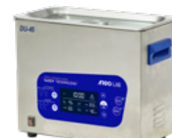
DU-32S | 45S | 65S