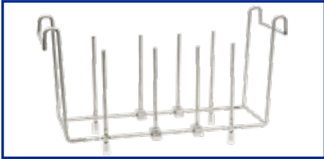
SS-200 supporto per la pulizia dei setacci (solo mod. AU-450, DU-450 S)

* Tutti i supporti per becker sono forniti con anelli in plastica diam: 91,7 - 72,0 - 52,0 - 32,5 mm