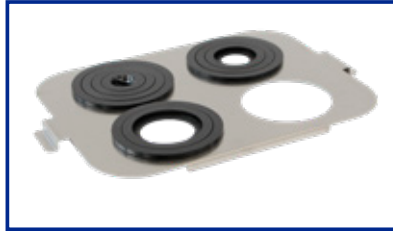
Supporto Becker per DU-100 S