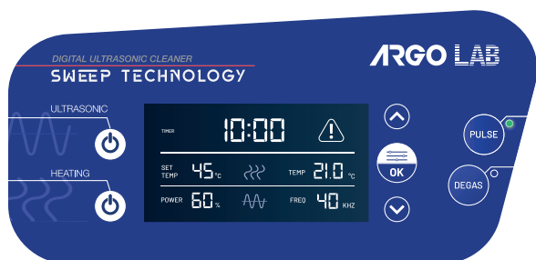
Pannello frontale Serie DU Sweep Technology