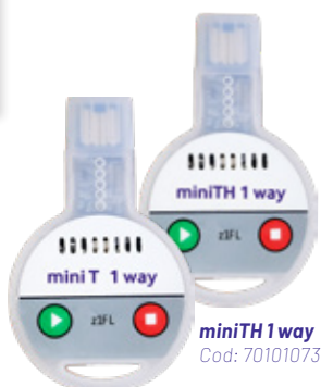
miniT 1 way