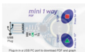
mini 1 way